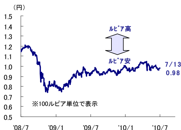
図表3. インドネシア・ルピア対円レート推移 (2008年7月14日～2010年7月13日)