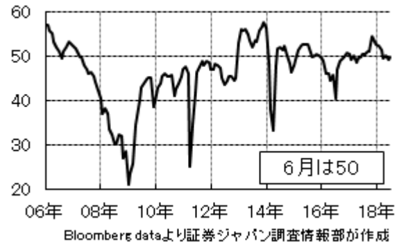
【参考】 景気ウォッチャー調査(先行き)