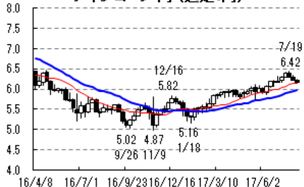
メキシコペソ・円 (週足:円)