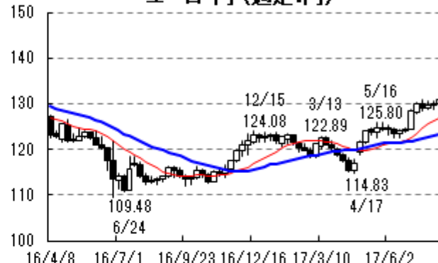
ユーロ・円 (週足:円)