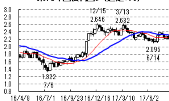
米10年国債利回り (週足:%)