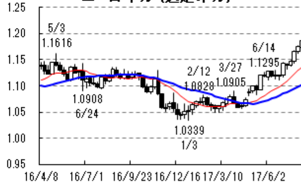
ユーロ・ドル (週足:ドル)