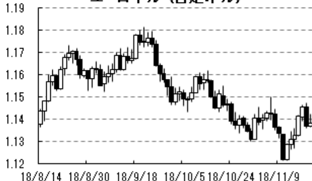
ユーロ・ドル (日足:ドル)