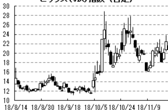
ビックス(VIX)指数 (日足)