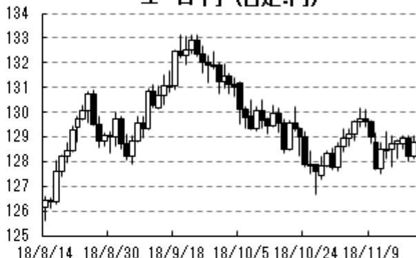
ユーロ・円 (日足:円)