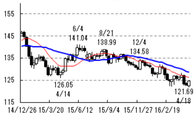
ユーロ・円 (週足:円)