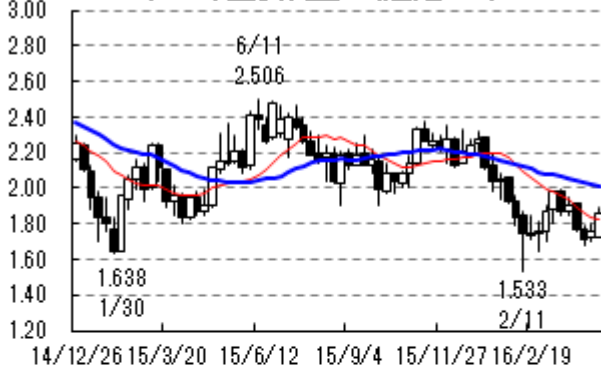
米10年国債利回り (週足:%)