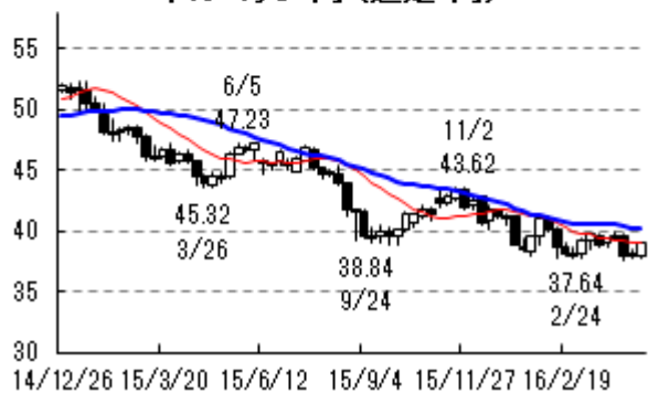
トルコリラ・円 (週足:円)