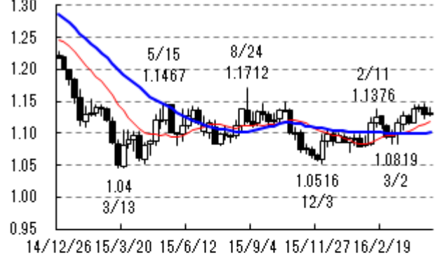
ユーロ・ドル (週足:ドル)